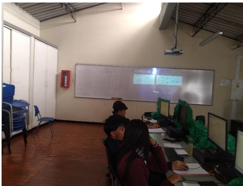
Colegio Aldemar Rojas Plazas ambientes de formación en optimas condiciones para la formación técnica en mantenimiento de automatismos industriales.