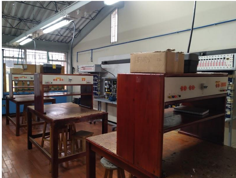
Colegio Aldemar Rojas Plazas ambientes de formación en optimas condiciones para la formación técnica en mantenimiento de automatismos industriales.